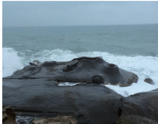
▲ 海浪的侵蝕，雕琢出獨一無二的景緻

如果未有到過野柳地質公園，一定不可能想像到大自然是何等的神奇。那裡經過長時間海蝕風化和地殼運動，形成了海蝕洞溝、蜂窩石、燭狀石等等特殊的地質景觀。當中，我們印象最深刻的是仙女鞋。相傳原本野柳岬是一隻龜，常常興風作浪危害當地漁民，天上的仙女知道後，便騎著一隻大象下凡來收服大龜，卻不小心將鞋子遺忘在海岸，從此這就變成了野柳的仙女鞋。野柳的奇石巧奪天工，我們一定要好好保護，不可讓它們受到破壞。