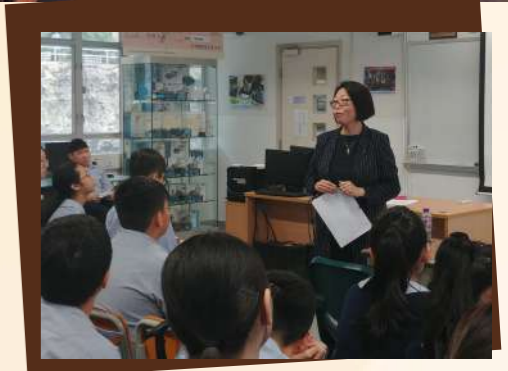
▲鄭博士給予同學很多寶貴的意見