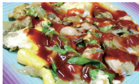
▲ 到台灣，不可不吃蚵仔煎