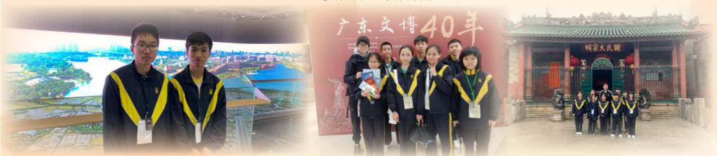
▲了解東莞城市現況