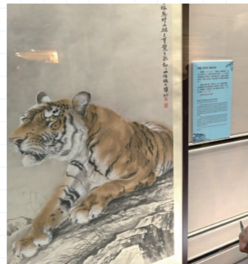
▲ 形神俱似的國畫老虎

宜蘭香格里拉休閒農場位於大元山麓上，四處鳥語花香，環境相當清幽，給人一種仿如置身世外桃園的感覺。我們在農場裡過了一個相當充實的晚上，我們搓湯圓，雖是第一次嘗試，但味道也非常美味。此外，我們來了一次打陀螺比賽，這看似容易的玩意，原來少一點技巧也不能，經過多次練習，我們才領悟到當中要訣。最令我們印象深刻的是放天燈，我們的天燈非常巨型，一個天燈已足夠一班同學寫上誠心的祝願。看著天燈升到夜空的盡頭，我深信我們的願望一定可成真。