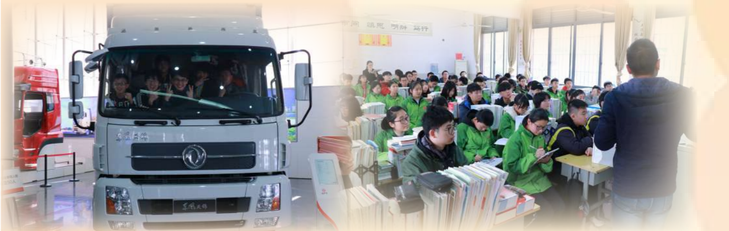
▲ 同學參觀東風汽車廠