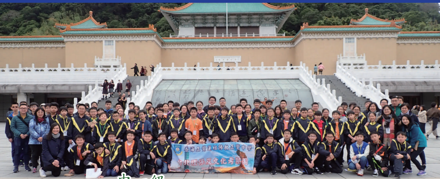
▲ 攝於台灣國立故宮博物院