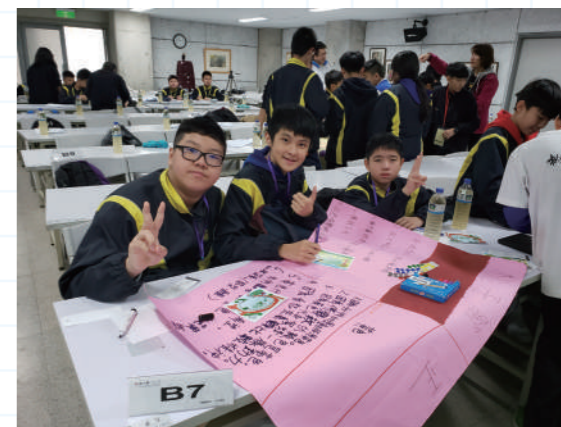
▲ 要好好設計新行程

台北之旅雖然早已結束，但我們在這台北幾天所學卻是深刻的。回港後，我們一直希望能把自己的學習心得與學弟學妹分享，於是我們認真檢討及反思，並把零碎的記憶重新梳理，過程雖不容易，然經過我們的努力，終完成了一份名為「沉澱後再出發」的專題報告。我們保留了不少值得一去的景點，同時也建議刪去部分地方，並推薦了若干我們認為值得一去的新地方，期望為未來中一同學提供體驗學習的新攻略。