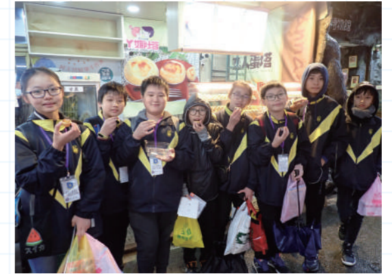
▲ 老街上的地道懷舊小食

我第一次去台灣，就喜歡上了這個地方。台灣人的熱情、台灣美食的味道、台灣風貌、台灣人的高素質，都給我的一種舒適感。就在短短的一程淡水老街的遊覽，已深深體會到台灣的可愛之處。淡水老街市容整潔，即使是售賣小食的攤檔很多，但也不會烏煙瘴氣，檔主都很熱情，知道我們是來自香港的學生，都熱情招待，充滿笑容。台灣的街頭小食充滿古早味，而且種類繁多，我們就品嚐了炸熱狗、糖葫蘆、雞蛋糕、牛肉麵等，全都美味可口，各有不同特色，價錢又便宜。這些特色，實在香港非常不同。