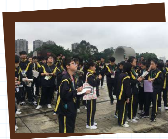
▲ 參觀東深供水泵站