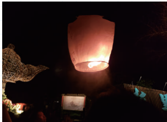
▲ 升上天際的天燈，仿如夜空中的一點星光