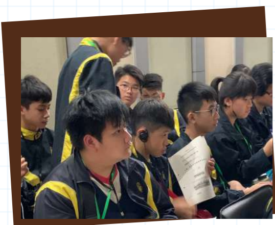
▲ 細心聆聽供水工程